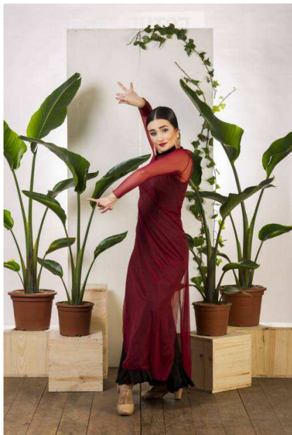
3979 – VESTIDO SANTOMERA VESTIDO TUL ELÁSTICO M/L CORTES LATERALES