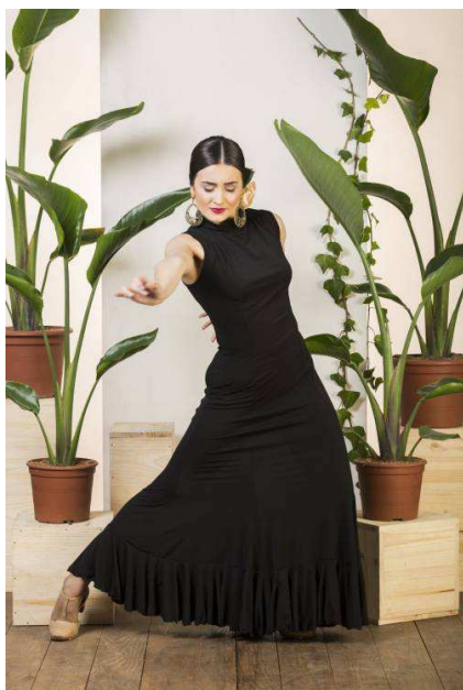
3980 – VESTIDO ULEA VESTIDO CUELLO ALTO CON VOLANTE INFERIOR