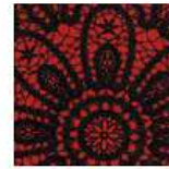
ET386 - Punto Elástico KnitStretch