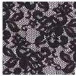
ET343 - Encaje Burdeos Burgundy Lace