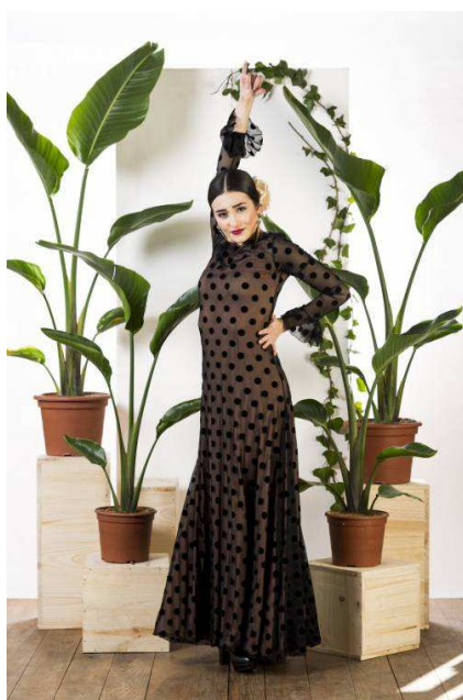
3984 – VESTIDO OJANCO VESTIDO M/LARGA CON 3 GODETS Y VOLANTE EN MANGA