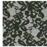
ET370 - Encaje Verde Green Lace