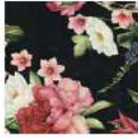
ET387 - Punto Elástico KnitStretch