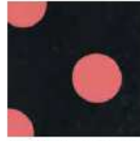
ET389 - Punto Elástico KnitStretch