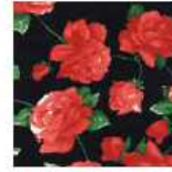
ET391 - Crespón - Crepe