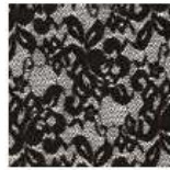
ET354 - Encaje Negro Black Lace