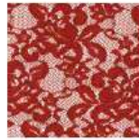
ET369 - Encaje Granate Ruby Lace