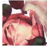
ET388 - Punto Elástico KnitStretch